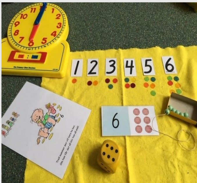
Samband mellan siffra, räkneord och antal