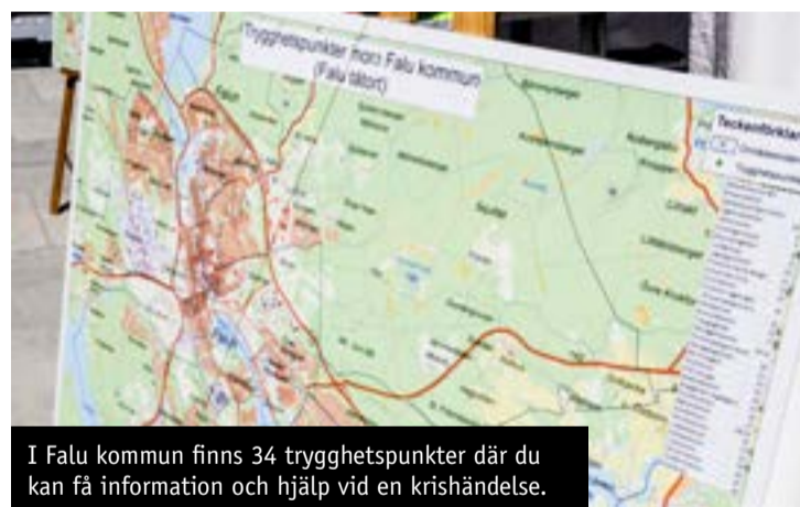
I Falu kommun finns 34 trygghetspunkter där du kan få information och hjälp vid en krishändelse.

Frivilliga resursgruppen (FRG) Falun besökte under Krisberedskapsveckan bland annat Grycksbo, Bjursås, Sundborn, Svärdsjö, Enviken och flera platser i tätorten Falun. Där kunde invånarna få reda mer om trygghetspunkter, hur man klarar sig i 72 timmar utan vatten och el, vad ett "viktigt meddelande till allmänheten" (VMA) är för något och vilka resurser Falu kommun har vid en kris.