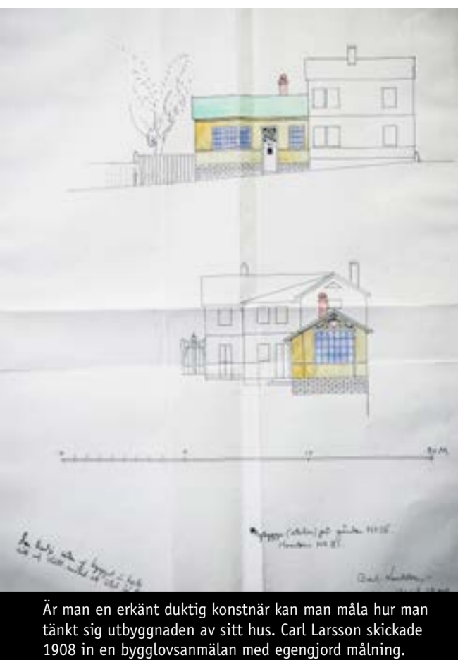
Är man en erkänt duktig konstnär kan man måla hur man tänkt sig utbyggnaden av sitt hus. Carl Larsson skickade 1908 in en bygglovsanmälan med egengjord målning.