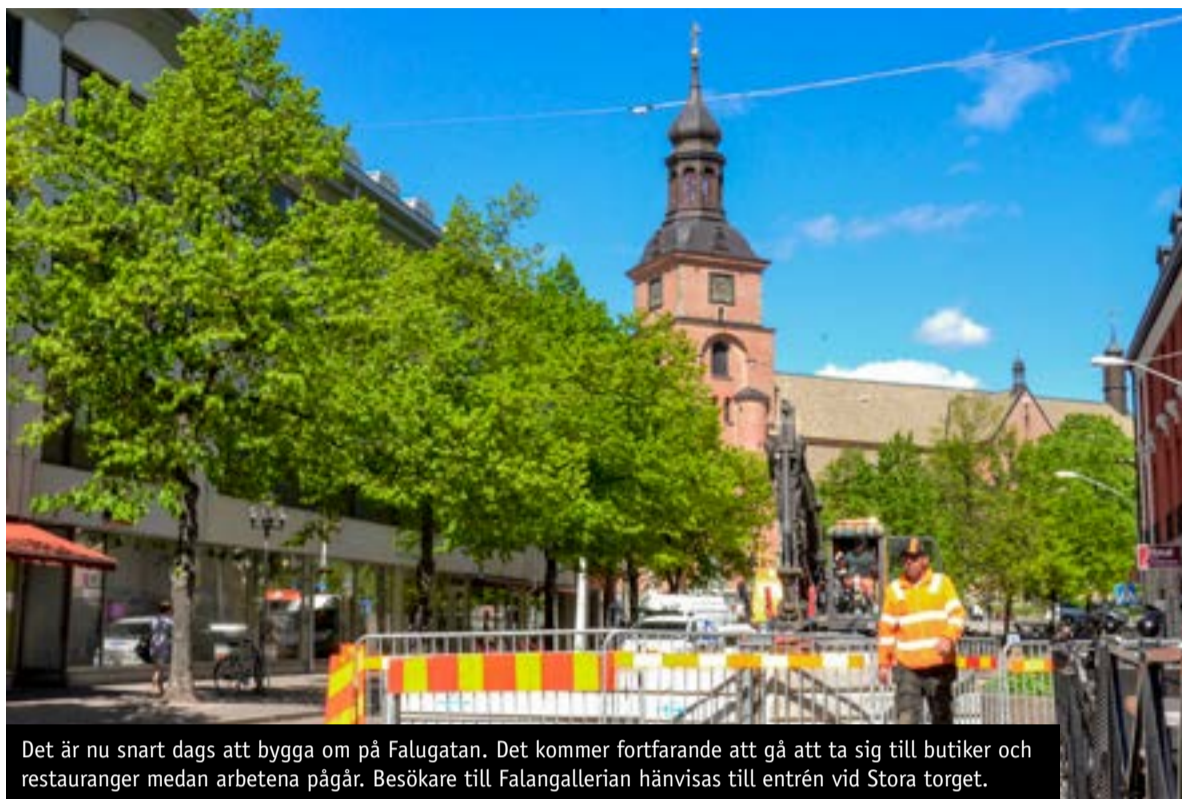
Det är nu snart dags att bygga om på Falugatan. Det kommer fortfarande att gå att ta sig till butiker och restauranger medan arbetena pågår. Besökare till Falagallerian hänvisas till entrén vid Stora torget.