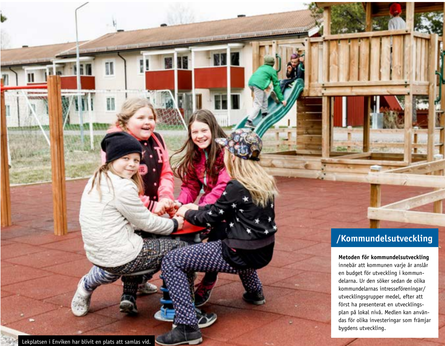
Lekplatsen i Enviken har blivit en plats att samlas vid.