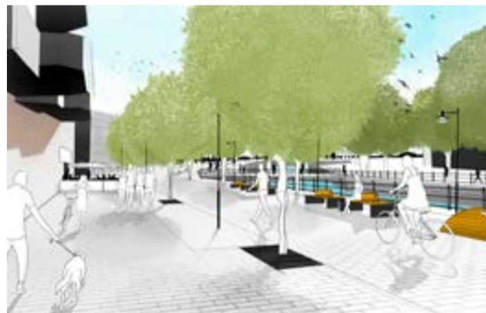
↑ Östra hamngatan som den är tänkt att se ut när den är klar. Skiss av David Qvick, Confetti.

Arbetet med Falugatan planeras starta den 3 juli. Samtidigt öppnas också Östra Hamngatan för gång- och cykeltrafik. När arbetet på Falugatan startar kommer framkomligheten på gatan att bli sämre, men det kommer att vara tillräde till alla bostäder, butiker och restauranger under hela byggperioden. Byggstaket kommer vara uppsatta för att skilja gångtrafik och arbeten åt. In- och utgången till Falagallerian mot Falugatan stängs under byggperioden, men entrén i hörnet mot Stora torget är öppen som vanligt.