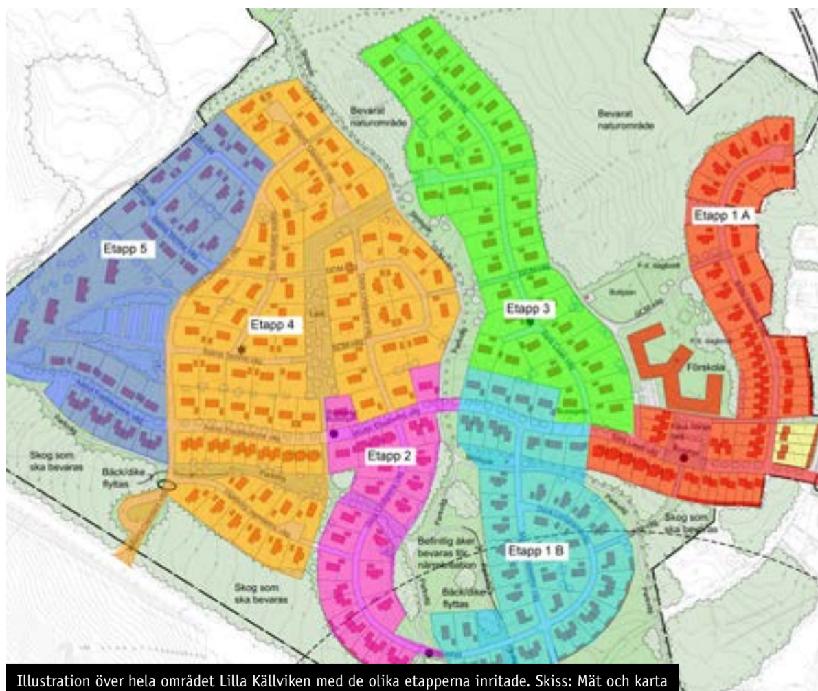
Illustration över hela området Lilla Källviken med de olika etapperna inritade. Skiss: Mät och karta

Etapp 4, som planeras att vara klart i årsskiftet 2018/19, ligger längre upp och har nu avverkat från skog, och kommer att innehålla ett 70-tal villatomter på såväl kommunens som OBOSs mark. Etapp 5 är sedan sista området längst upp mot Tallen som ska förberedas för bostäder. I etapp 5 är det även planerat för flerbostadshus.