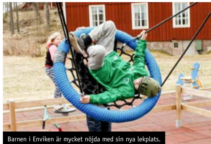
Barnen i Enviken är mycket nöjda med sin nya lekplats.