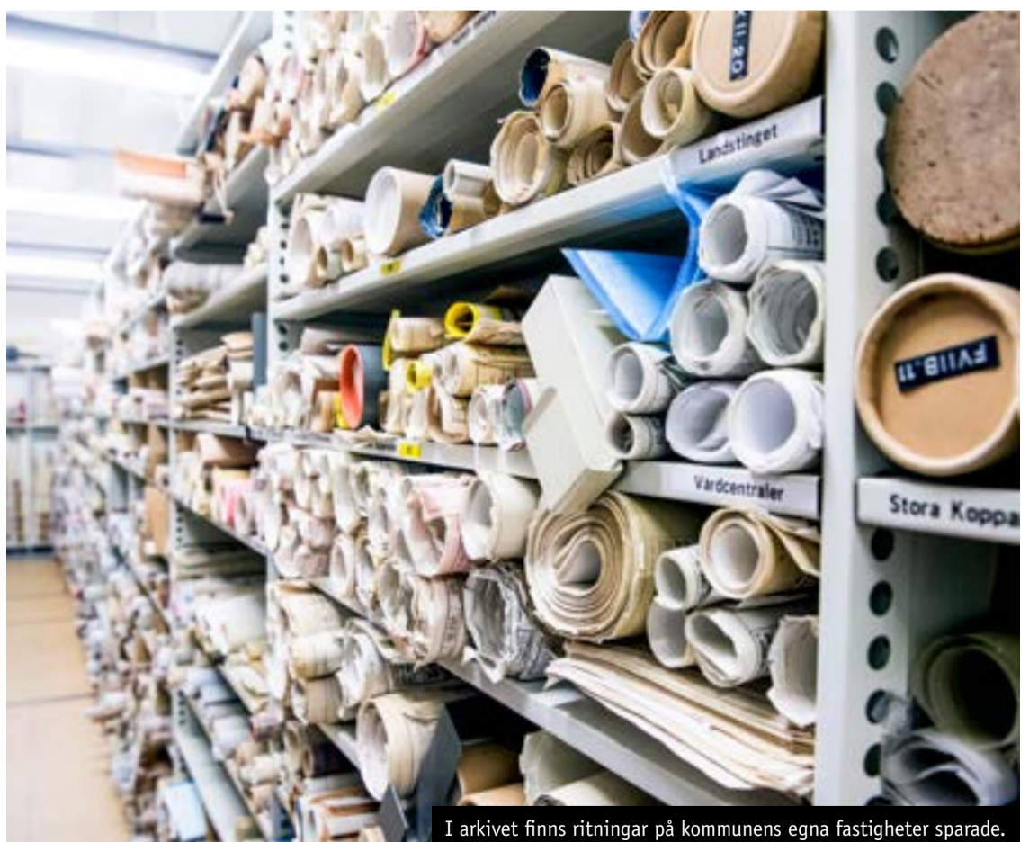
I arkivet finns ritningar på kommunens egna fastigheter sparade.