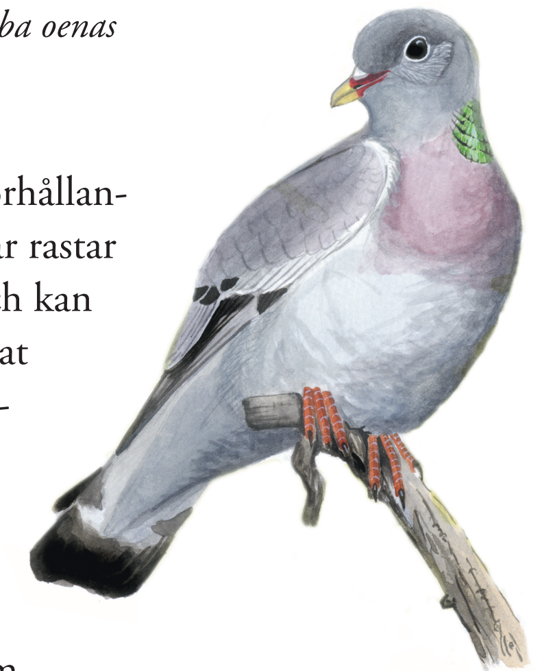
Skogsduva Columba oenas