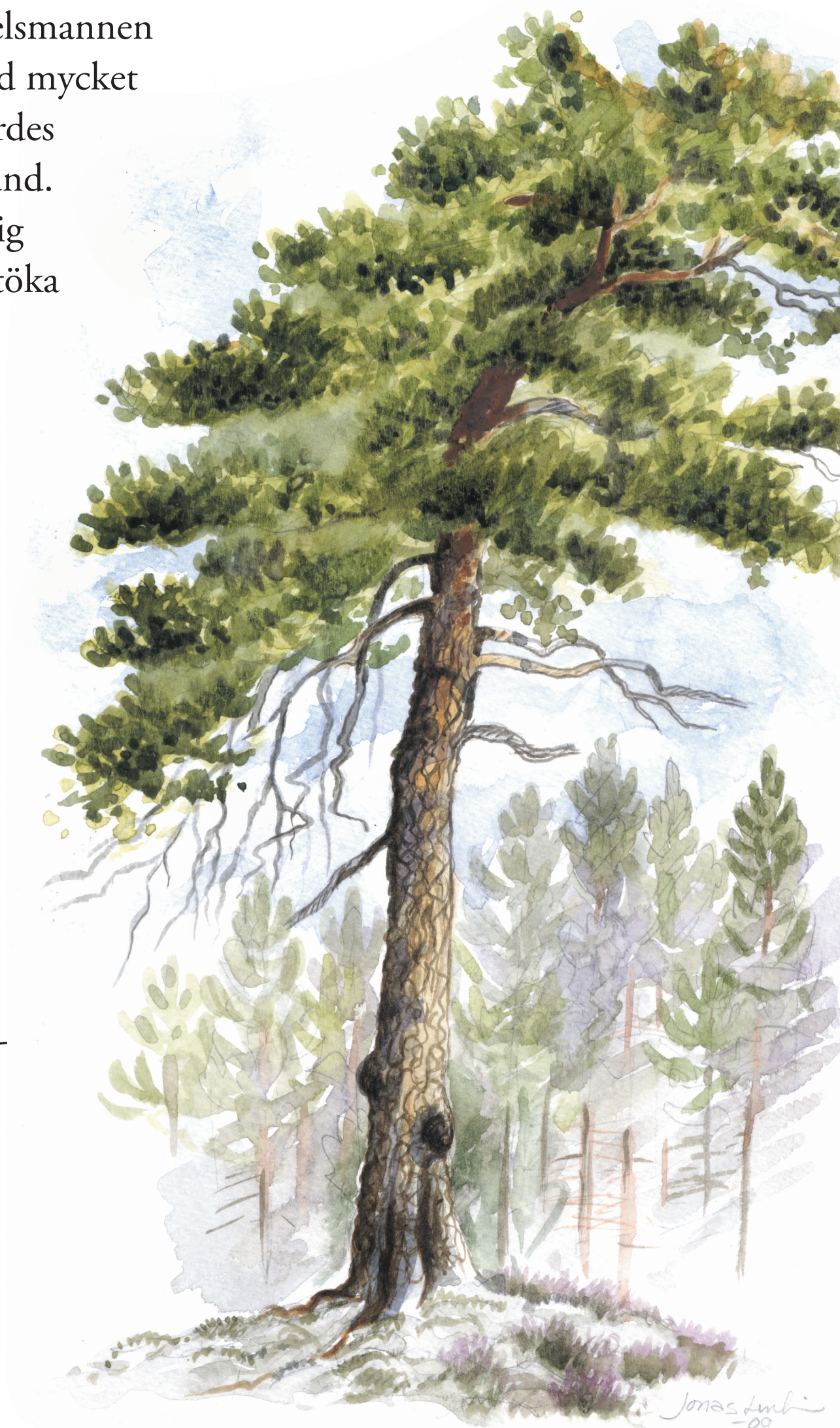
Gammal tall Pinus sylvestris

I den grovt stenskravliga stranden på sydöstra sidan står riktiga gammeltallar. Det är skruvade, 350-400-åriga bjässar, med grova grenverk och närmare tre meters omkrets, som har hackspettshål och gnag av ovanliga skalbaggar.