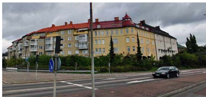
Byggnaderna i kv Bergmästaren.