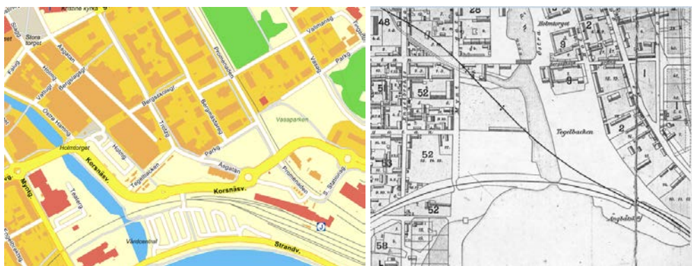
Området rund kv Rödbro idag och 1886 (Skarins karta).

Kvarteret Rödbro ingår i området Falu centrum, och ligger som en länk mellan äldre bebyggelse i form av Johanssonska huset, stationsområdet och kvarteret Bergmästaren och det moderna området för handel och kontor runt Holmtorget, som tillkom i samband centrumomvandlingen på 1960-talet och resulterade i de stora affärshusen i kvarteren Gamla Bergsskolan, Holmen och Yttre Åsen.