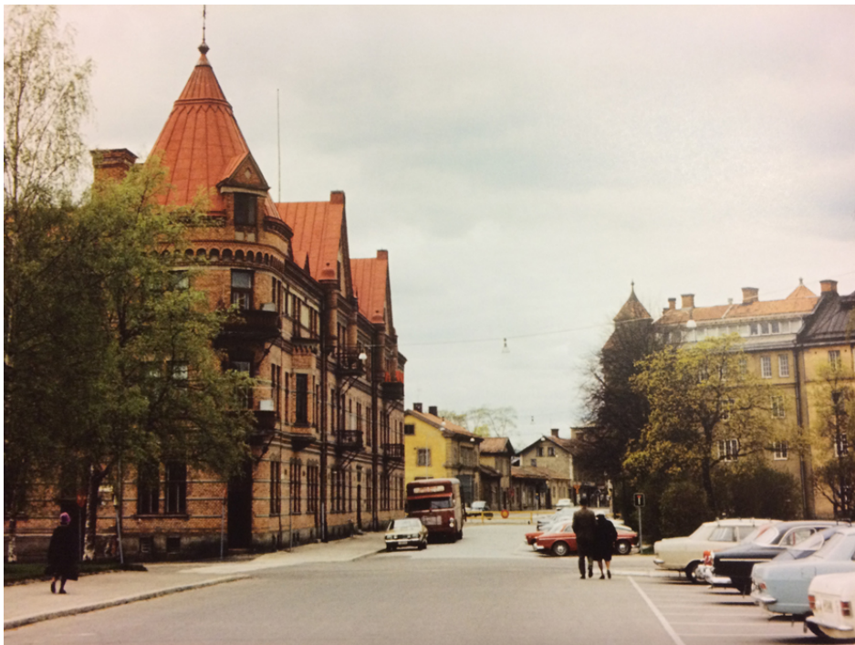
Johanssonska huset i nutid och dåtid.