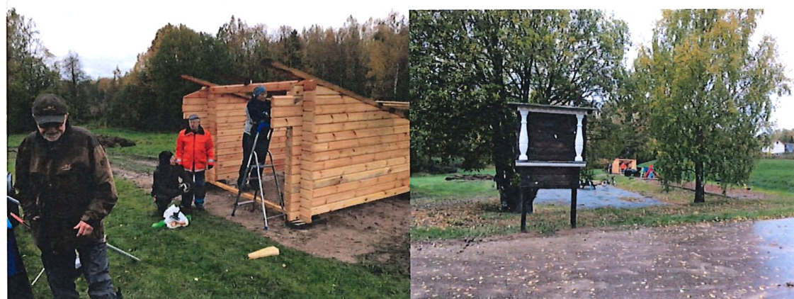
Slogbod vid lekparken