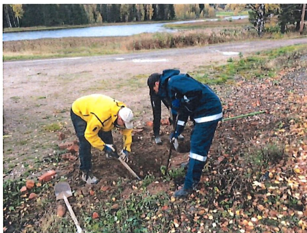
Grävning för anslagstavla